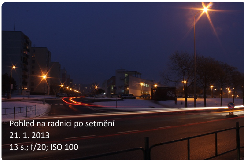
Pohled na radnici po setmění 21. 1. 2013 13 s.; f/20; ISO 100