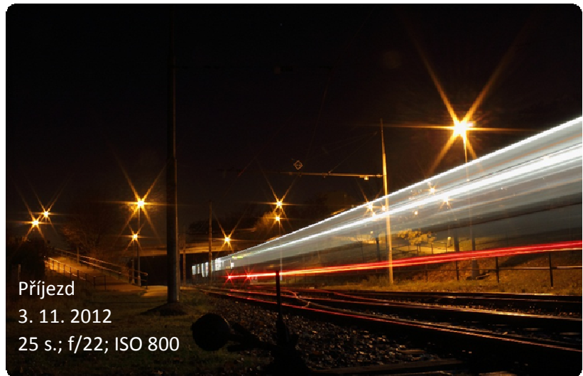
Příjezd 3. 11. 2012 25 s.; f/22; ISO 800