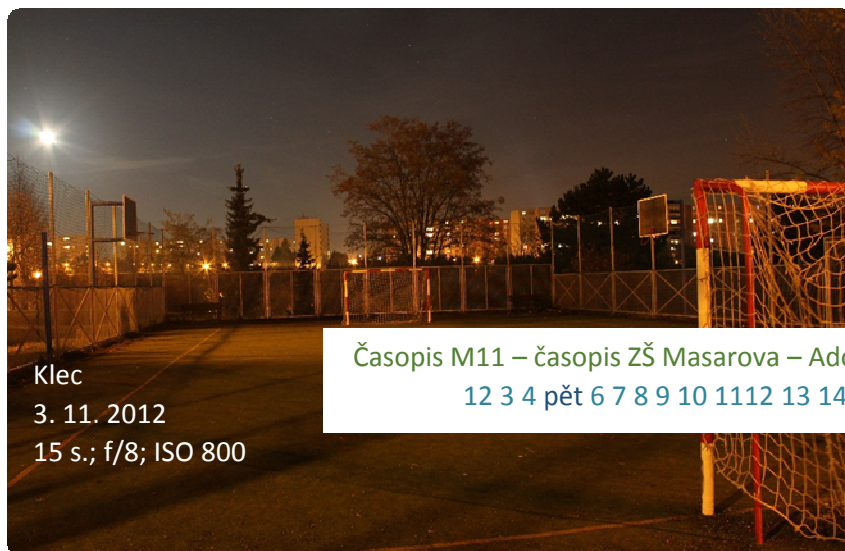
Klec 3. 11. 2012 15 s.; f/8; ISO 800