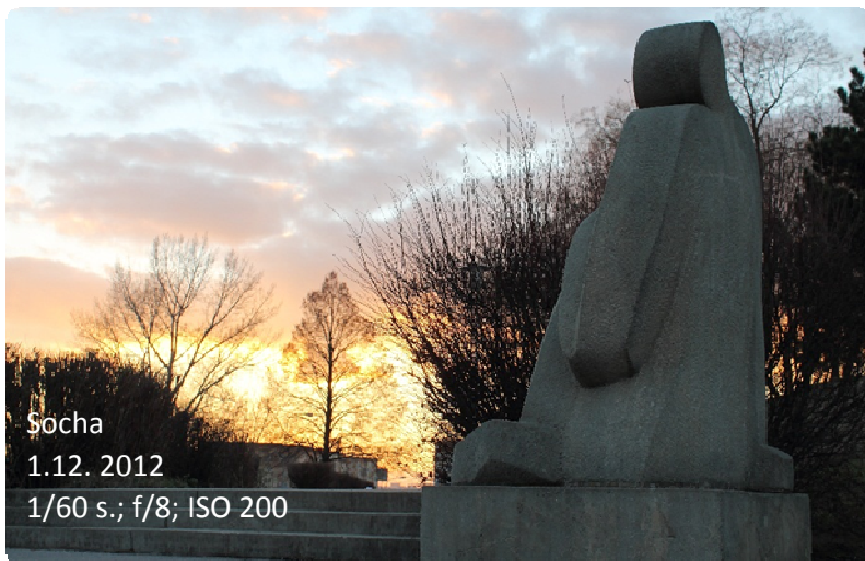
Socha 1.12. 2012 1/60 s.; f/8; ISO 200