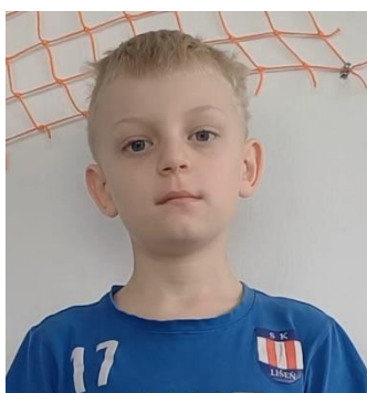
Kuba, 2. B

Ano, každý rok chodíme za holkama s tatínkem.