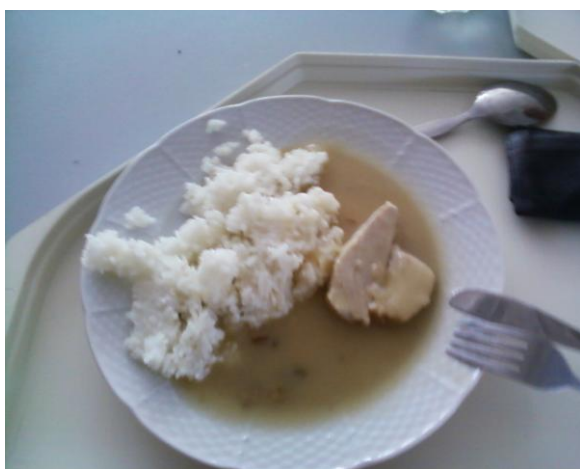
Název jídla není redakci znám

Na závěr je potřeba říci jednu důležitou věc: CO NEZNÁTE, NEJEZTE!