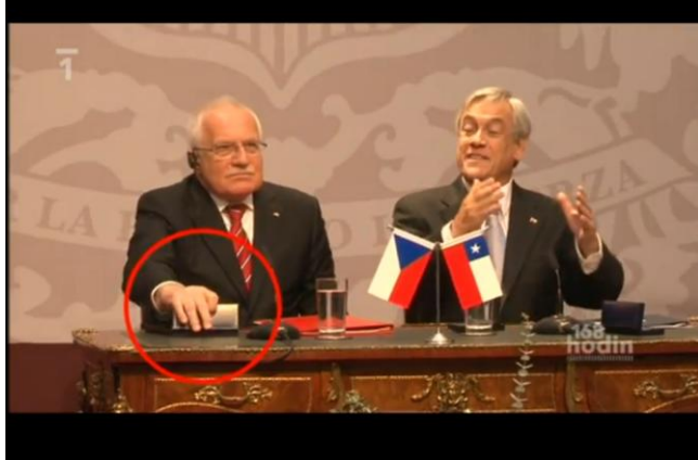
Obr. 3 - Aby to nebylo nápadné, prázdná krabička se musí zavřít...