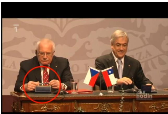
Obr. 1 - Pan prezident zkoumá pero