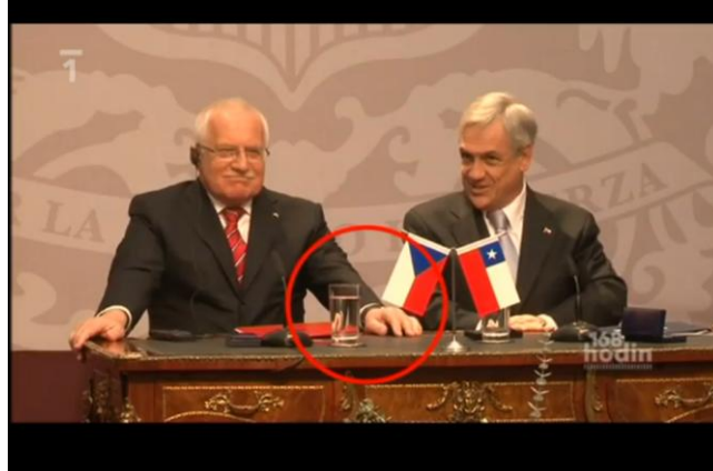
Obr. 4 - Úsměv pana presidenta - lup se mu podařil...

O tom musíte už taky vědět – pan prezident „znárodnil“ chilské protokolární pero. O tom, jestli na toto jednání měl či neměl právo, je otázka do diskuse. Každopádně záběry, jak pan prezident bere pero, obletěly svět. Jenom na YouTube video vidělo okolo 5 000 000 diváků. Kromě toho video odvysílaly i takové stanice jako CNN, BBC, ABC, Al - Jazeera a Fox news. Jak vlastně „krádež“ probíhala? Po podpisu smlouvy zůstalo po K. Schwarzenbergovi (český ministr zahraničí) pero v krabičce na stole. Pan prezident se nejdřív do krabičky podíval a znalecky pokýval nad úlovkem (Obr. 1). Poté pero strčil pod stůl (Obr. 2) a pod stolem ho strčil do druhé ruky a pak do své kapsy. Nakonec si sako zapnul a zaklapl i pouzdro, které zůstalo otevřené (Obr. 3). Poté, kdy krabičku schoval na nenápadné místo, se mu na tváři objevil úsměv (Obr. 4). Jenom mě zajímá, jestli odnesl i to pouzdro. Nakonec malá perlička: Víte, co znamená německy „Klau es“? Ukrást, či krást.