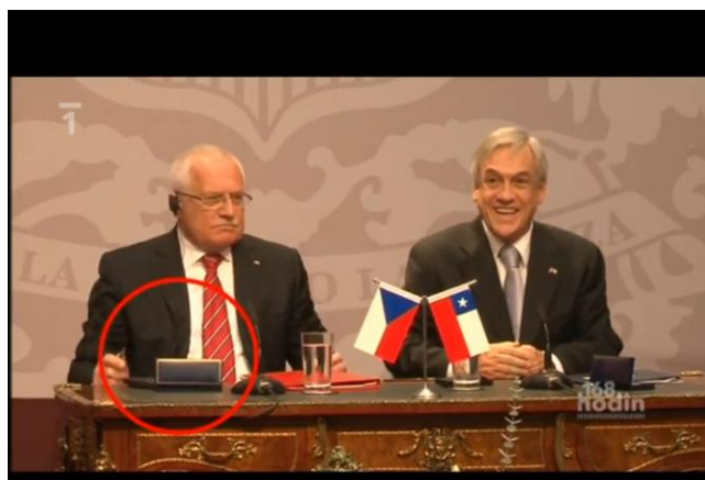
Obr. 2 - Pero mizí pod stolem...