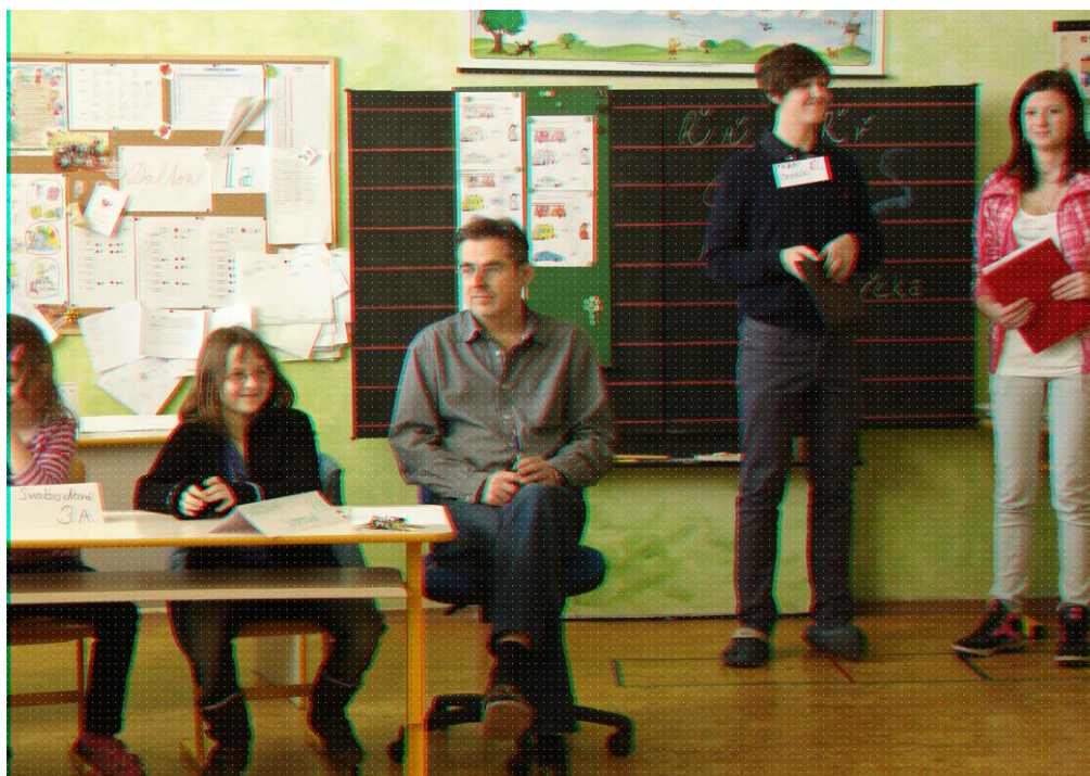
Zapsal M. Kos