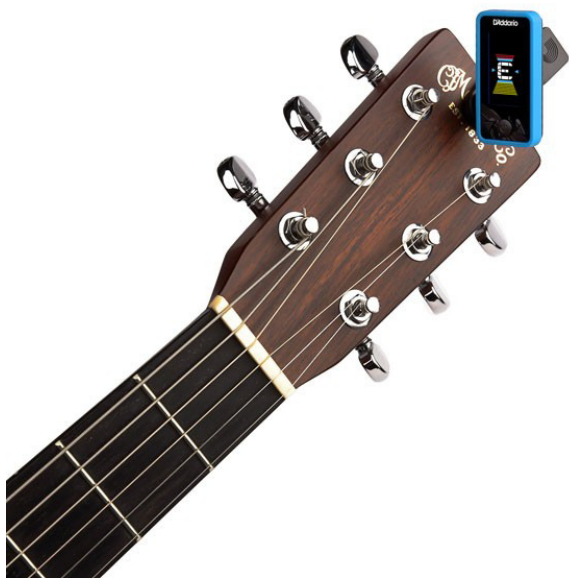
Obrázek 3 Ladička